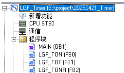
图 2.1.1 程序库