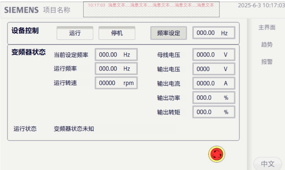
图 3.3.1 画面内容